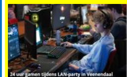
Start 10 februari a.s.