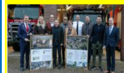
Handtekeningen gezet voor bouw nieuwe brandweerkazerne