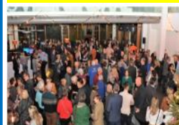
Nieuwjaarsreceptie Gemeente druk bezocht