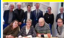
Hulp in stembokje Voor mensen met beperking